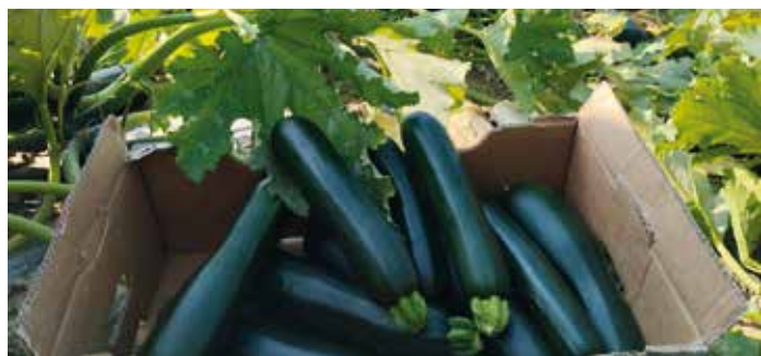
Sveže nabrani vzorci bučk