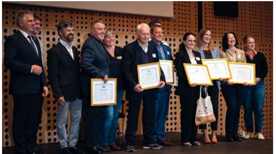
Prejemniki priznanj Združenja kmečkih sirarjev Slovenije

Na četrtem Festivalu slovenskih sirov, ki je v začetku februarja potekal na Brdu pri Kranju, je bilo podeljenih sedem priznanj za prispevek k razvoju slovenskega sirarstva na kmetijah in podporo slovenskim kmečkim sirar-