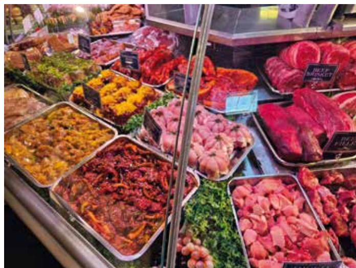
Primer mesne predelave in predelava zelenjave kot del ponudbe v trgovini na kmetiji

Po drugi strani pa se svetovalci občasno srečamo tudi s kmeti, ki imajo svojo dopolnilno dejavnost že precej dobro razvito, a se zaradi različnih razlogov ne odločijo za prigrasitev in tako sami sebe omejujejo predvsem pri prodaji izdelkov na trgu.