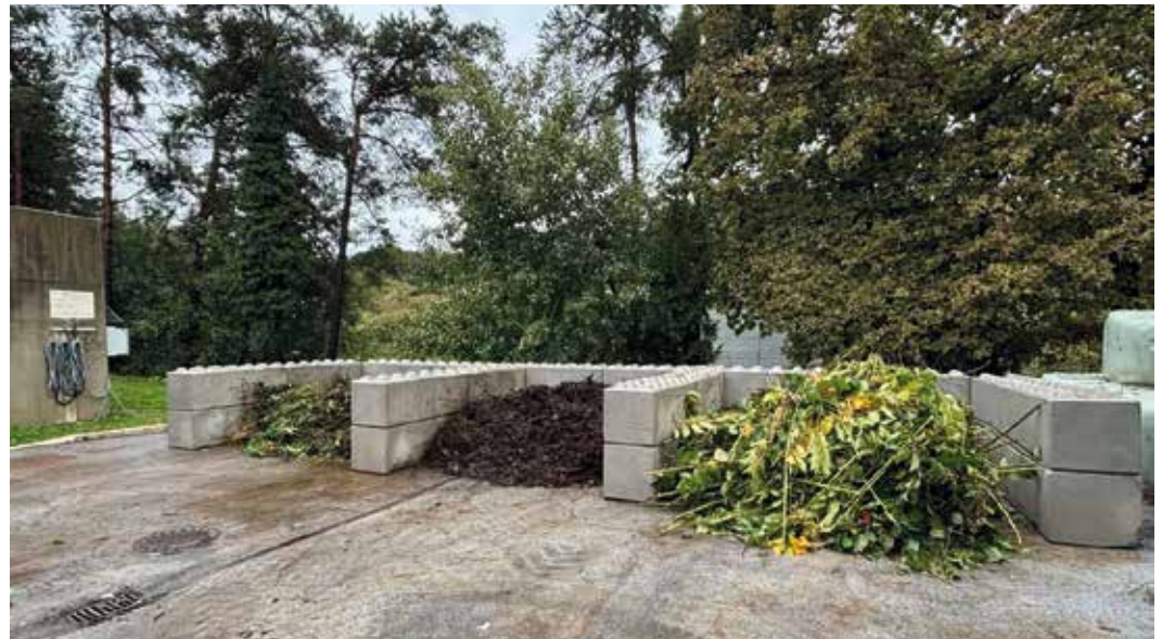
Levo zeleni odrez – nezmulčan, v sredini zeleni odrez – zmulčan in pa desno dresnik – nezmulčan.

rijo tudi na zapuščenih vrtovih, obrežjih rek, vzdolž cest in železnic. Da bi to preprečili, je pomembno, da rastlinske ostanke odstranimo na pravilen način. Ena izmed učinkovitih metod je sežiganje, saj ta popolnoma uniči vse dele, iz katerih bi se lahko razvila nova rastlina. Seveda pa je sežig potrebno izvajati na za to urejenih mestih, ob nadaljnjem