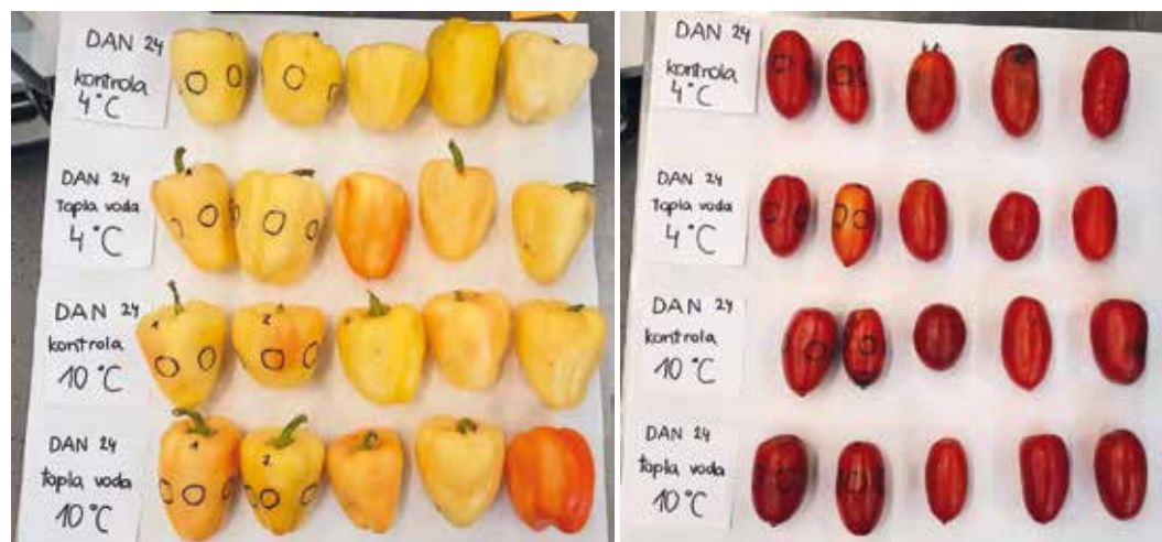
Vzorci paprike in pelatov v času poskusa

dan skladiščenja vzorcev pelatov, obdelanih s toplo vodo, je bila stopnja propadanja 19 odstotkov skladiščenih pri 4 °C in 25 odstotkov skladiščenih pri 10 °C. Pri neobdelanih vzorcih pelatov, skladiščenih pri istih pogojih, je ocenjena stopnja propadanja 62 odstotkov skladiščenih pri 4 °C in 87 odstotkov skladiščenih pri 10 °C. Topla voda ni povzročila poškodb, povečala je odpornost na fiziološko propadanje in na mikrobiološke okužbe –