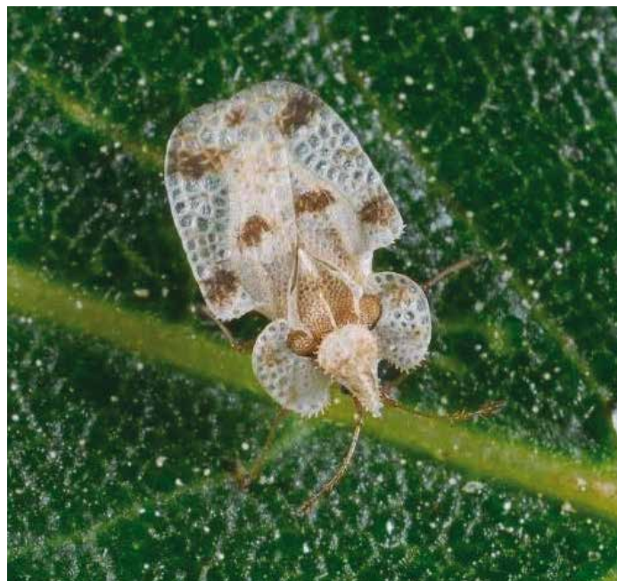
Čipkarke so ime dobile po značilnem mrežastem vzorcu, podobnem čipki.

stiteljskih rastlin, lahko tudi istočasno. Jajčeca so siva do črna, sodčasta, samica jih odloži v skupinah. Ličinke so manjše, bleščeče črne z bodičastimi izrastki po te-