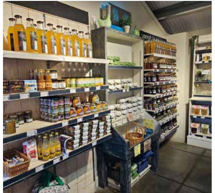
Primer dobre prakse: lastna trgovina na kmetiji

vam urejenost priporočam še z drugega vidika. Predlagam, da na svoje izdelke pogledate kot potencialni uporabnik, kar seveda tudi ste. Prepričana sem, da bi kot kupec tudi sami raje izbrali izdelek, za katerega veste, da je pripravljen v urejenih prostorih in je skladen s smernicami varne hrane. S tem, ko svoje prostore uredite tako, kot zahtevajo načela dobre higienske prakse, ter prigrasite dopolnilno dejavnost, jamčite za kakovost svoje ponudbe in to danes šteje vedno bolj. Poleg tehnoloških zahtev imajo posamezne dopolnilne dejavnosti tudi svoje pogoje, na katere