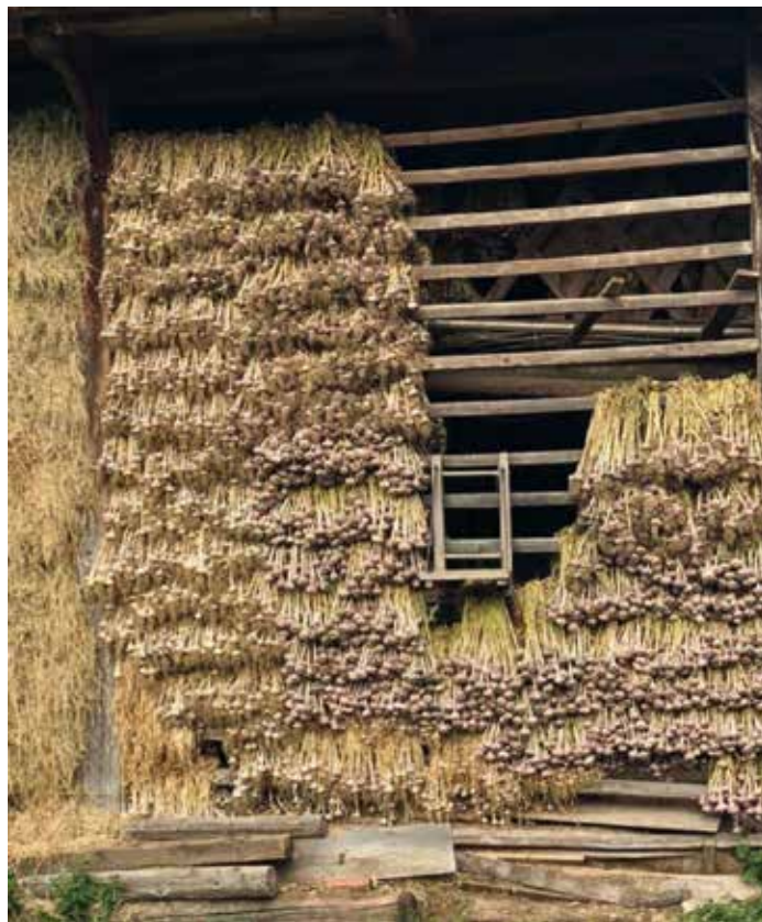
Manjše količine lukovk lahko sušimo kar z listi, kar je primerno tudi za stare kmetije.

Večje količine se sušijo s preprihovanjem. Prostor naj bo čim višji, po možnosti obložen z lesom. Čebule (česen ali čebula) nasujemo v zaboje, ki imajo med letvicami pred-