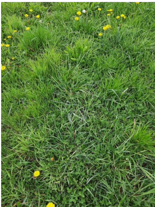
Slika 8: botanični sestav aprila 2023 naslednjega leta na vsejanem delu travnika (Zavodnik A.)

Drugo vzorčenje pridelka travinja je bilo opravljeno 9.8.2023, saj je bilo to območje zelo mokrotno in je bilo spravilo onemogočeno v primernem času. Rezultat je 22 t/ha zelinja na delu, ki je bil vsejan jeseni in 14 t/ha na delu, ki je bil vsejan spomladi. Pri vzorčenju je bilo ugotovljeno, da je bila večja masa zelinja na delu GERKa, kjer je dosejavanje potekalo jeseni.