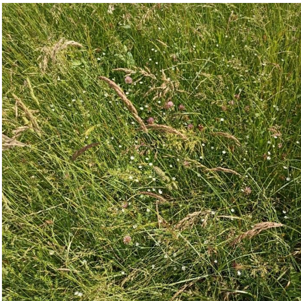
Slika 11: Travná ruša pred prvim odkosom