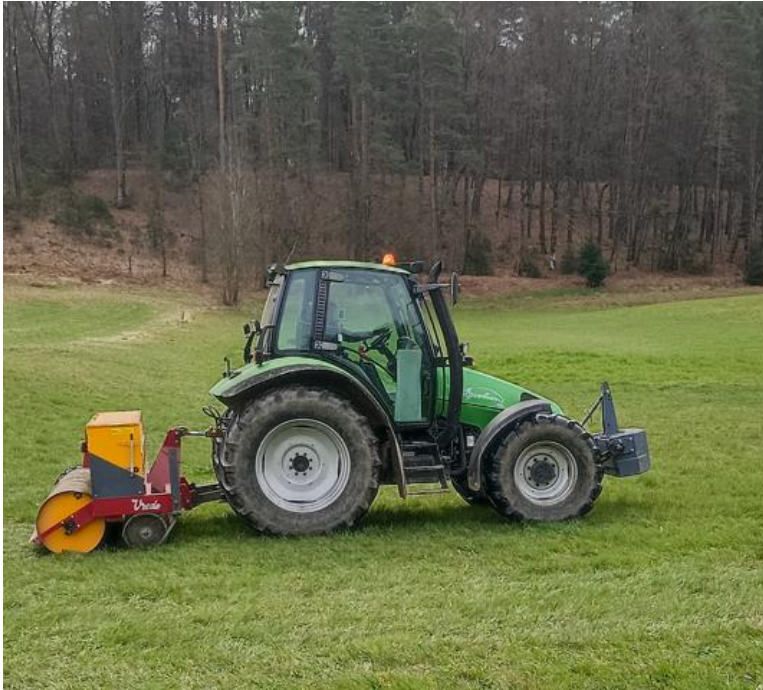
Slika 10: Fotografija dosejavanja: 20. 3. 2023

Na kmetiji so do sedaj opravili dva odkosa travne ruše in sicer 26. 5. 2023 in 9. 5. 2023. Oba odkosa so pospravili v obliki suhih bal.