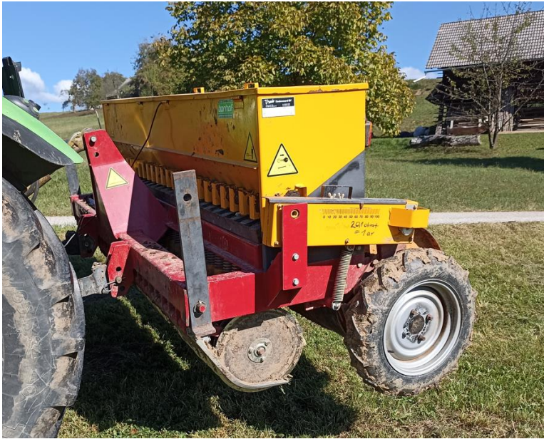
Slika 9: Fotografija dosejavanja: 21.9.2022

Prvo dosejavanje smo opravili 21. 9. 2022 s specializirano sejalnico za dosejavanje: Vredo 125.10.