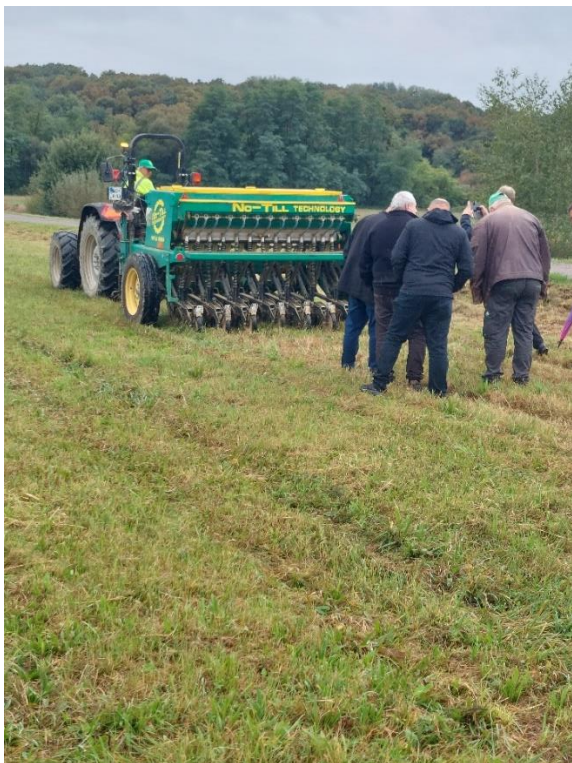
Slika 13: Prikaz vsejavanja v rušo