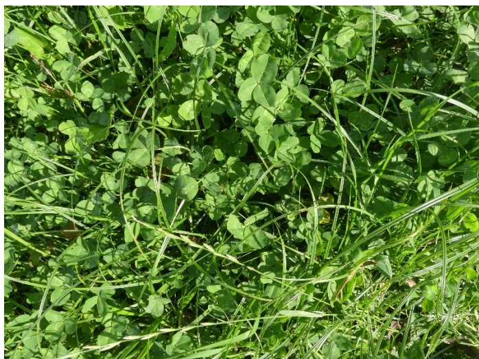
Slika 17: Gosta ruša po dosejavanju na poskusnem travniku