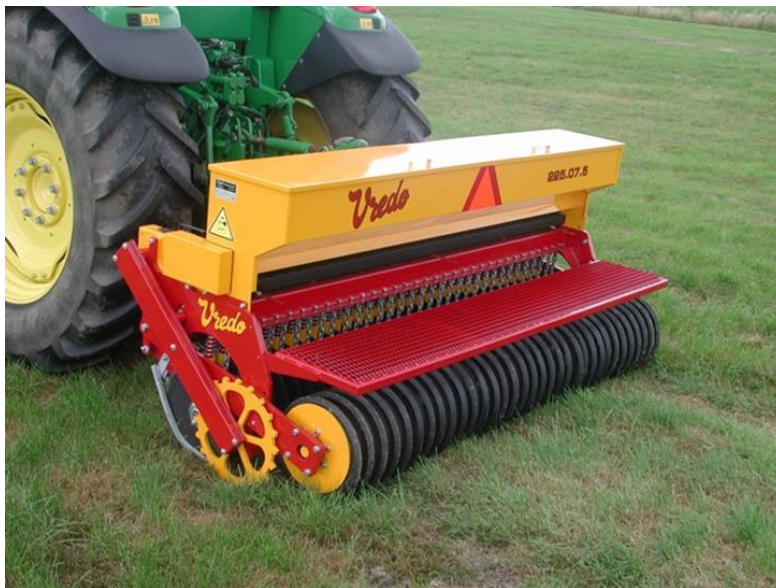
Slika 2: Vsejevanje v travno rušo (A. Zavodnik)

V seznamu na spletni strani MKGP imamo za vsejavanje na ekoloških kmetijah na razpolago dve mešanici in sicer travno deteljno mešanico Futterprofi KM bio in mešanico z dvema metuljnicama in 5 travami. Obe mešanici proizvaja podjetje Saatbau Linz. Poleg teh mešanic pa so na seznamu tudi posamezna semena metuljnic in ajde. https://www.gov.si/assets/ministrstva/MKGP/PODROCJA/KMETIJSTVO/Ekolosko_kmetovanje/PODATKOVNA-ZBIRKA-FEB/Podatkovna_zbirka_november-2021.xls .