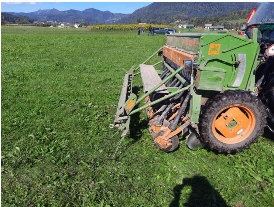
Slika 6: jesensko vsejavanje v degradirano travno rušo (Gabrenja N.)

Demonstracijski projekt »dosejavanje travne ruše« je potekal na govedorejski kmetiji Erbežnik Izidorja iz Zaklanca 29, 1354 Horjul. Izbrali smo močno degradirano travinje na GERKU »Pri kozolcu«. Za poskus so dosejali travno mešanico GRÜNLANDPROFI TOPP.