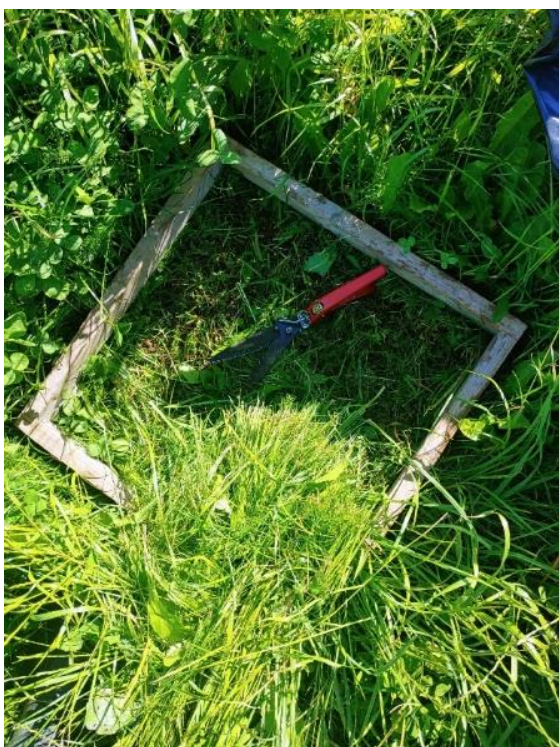
Slika 5: vzorčenje 2. košnje (Vodopivec M.)

Prvo vzorčenje pridelka travinja je bilo opravljeno 22.5.2023. Pri vzorčenju je bilo ugotovljeno, da je večja masa zelinja bila na delu GERKa, kjer je potekalo dosejavanje jeseni . Preračunana vrednost pridelka je 31.200 kg zelinja / ha. Na delu GERKa, kjer je potekalo spomladansko dosejavanje travne ruše je bil pridelek preračunan na ha manjši in sicer 22.400 kg zelinja / ha. Ocenili smo tudi botanično sestavo travne ruše. Pri jesenski setvi smo ocenili 77,5% trav, 13,75% zeli in 8,75%metuljnic. Od zeli je