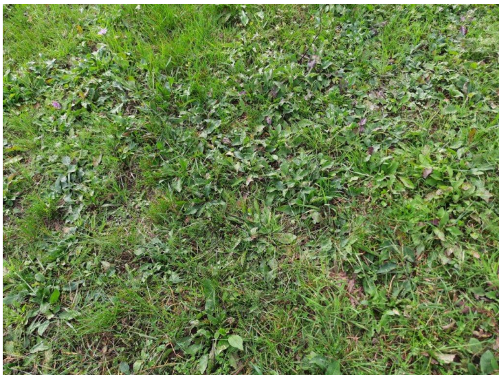
Slika 7: botanični sestav travne ruše pred vsejavanjem septembra 2022 (Gabrenja N.)