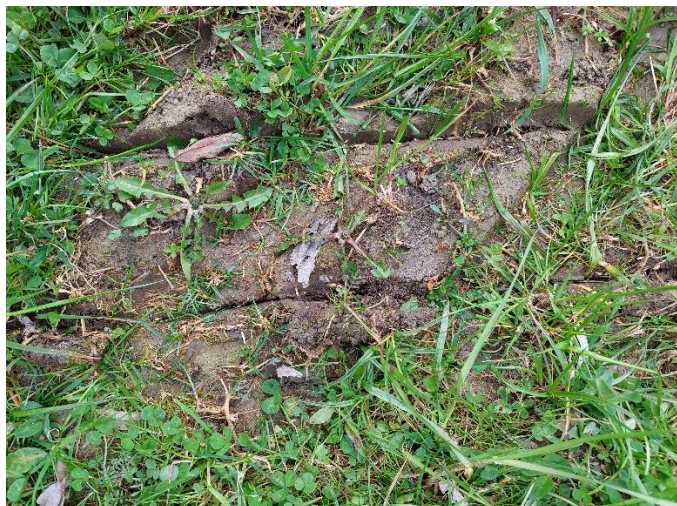
Slika 16: Sejalnica v rušo vreže plitve brazde in vanje odloži seme