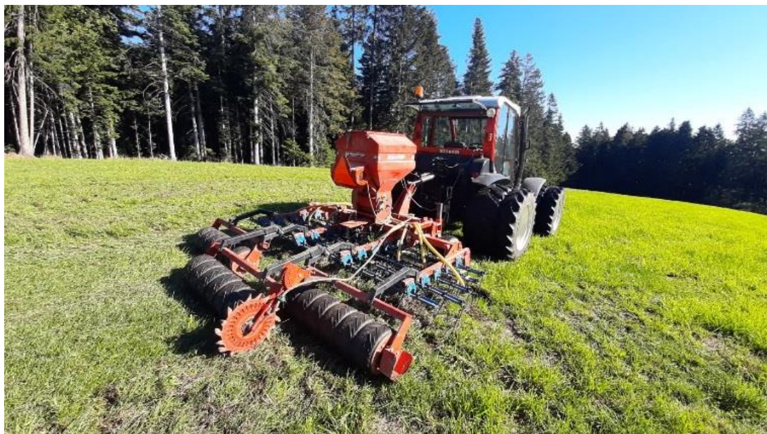
Slika 3: Jesensko dosejavanje travne ruše – mehanizacija

Dosejavanje je potekalo v dveh terminih. Jesenska setev je bila opravljena 23. 9. 2022 in spomladanska setev 12. 4. 2023. Površine v poskusu so se tekom rastne sezone gnojile dvakrat, prvič 30. 5. 2023 z 22.500 l gnojevke / ha in drugič 1. 7. 2023 z 18.000 l gnojevke / ha.