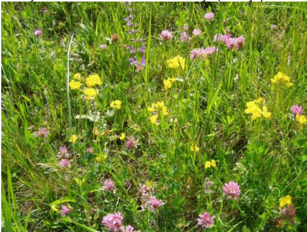
Slika1: Primeren botanični sestav in ohranjena biotska pestrost (Zavodnik A.)

Za pridelavo kvalitetne voluminozne krme je najprimernejša tista travna ruša, ki je sestavljena iz 50-70 % trav ter 10-30 % metuljnic, vsebuje pa tudi od 10-30 % zeli.