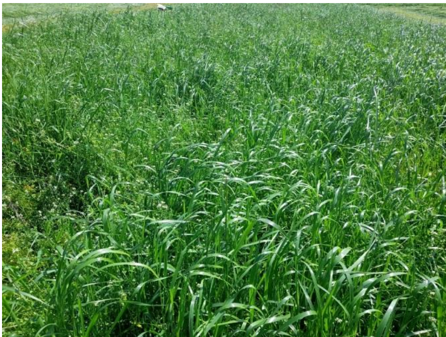
Slika 4: Vzorčenje 1. košnje – spomladansko dosejavanje (Vodopivec M.)