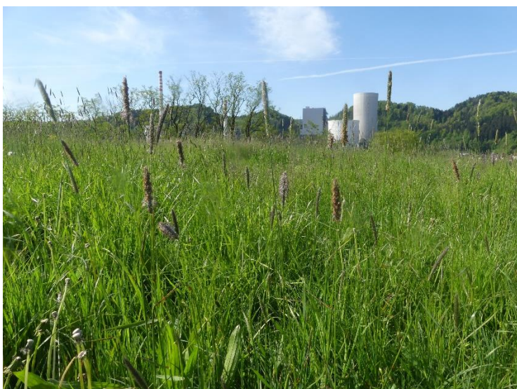
Slika 14: Dosejavanje je bilo izvedeno na travniku v Šoštanju

1. Prvi poskus smo izvedli na kmetiji Petra Apat, Gaberke 214, Šoštanj. V poskus smo vključili 1,43 ha velik travnik GERK 712651 -Travnik Gorice (400 m nadmorske višine). Za vsetev smo uporabili mešanico TRAVNIK BREZ DETELJE, vsakič po 10 kg. Jesensko setev smo opravili 18. 9. 2023, spomladansko pa šele po opravljeni 1. košnji, saj pred tem tega zaradi vremenskih težav na začetku in previsoke trave na koncu nismo mogli narediti. Vsejali smo torej šele 9. 5. 2024. Gnojenje: jeseni 23 m 3 gnojevke; 15.4. →100 kg Rhizovit 31; 15. 5. →80 kg Rhizovit 31; 4. 7. →80 kg Rhizovit 31. Pri primerjavi pridelka smo najprej ocenili deleže trav, metuljnic in zeli v ruši, nato pa pokosili in stehali pridelek svežega zelinja na površini 1 m 2 (3-krat oz. 5-krat na vsakem delu, rezultat je povprečje).