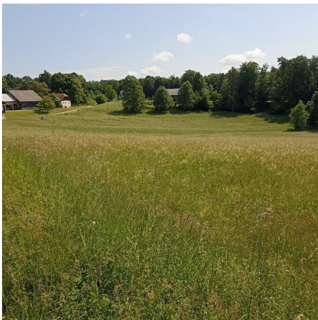
Slika 12: Travná ruša pred prvim odkosom